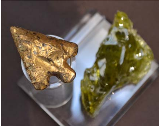
- Flèche en verre (à gauche) Expérimental - Collection Olivier Notter - Echantillon de verre en fusion précipité dans l'eau (à droite) France (Verrerie de Biot) - Collection MAP