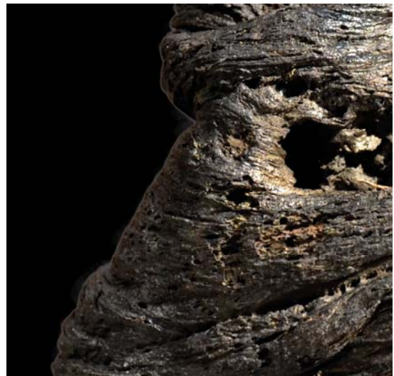
Lave cordée Hawaï