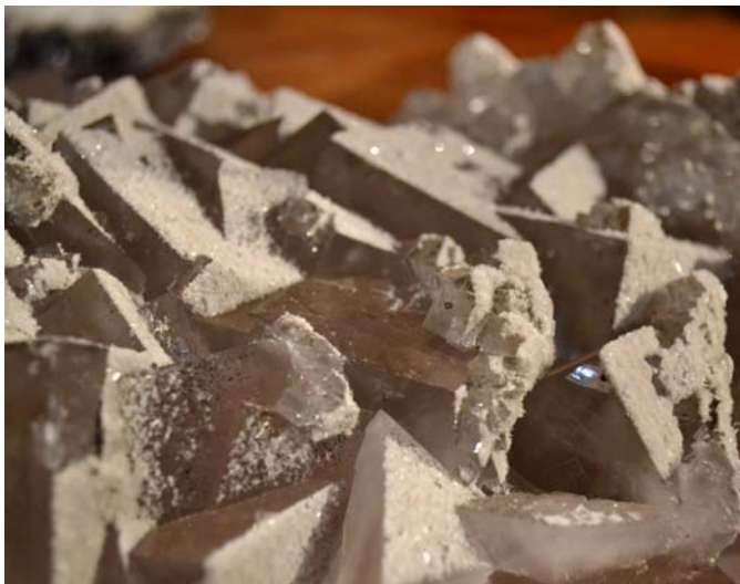
- Fluorite Estérel - Collection Pierre Rolland