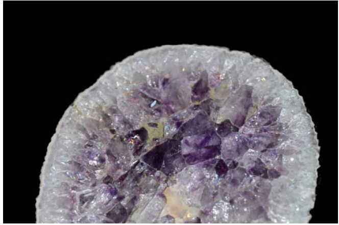
- Améthyste de l'Estérel France - Collection Pierre Rolland