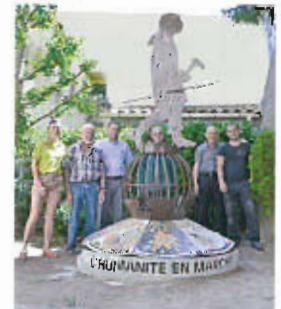
Installation de la statue devant le musée

Réalisation Isabelle Chemin, Louis Gasiglio et SCERMEL