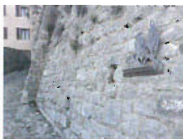
Installation de sculptures acier réalisées par SCERMEL (avec QR code) dans la montée du village, relatant en 7 étapes, l'aventure de l'Homme depuis un million d'années