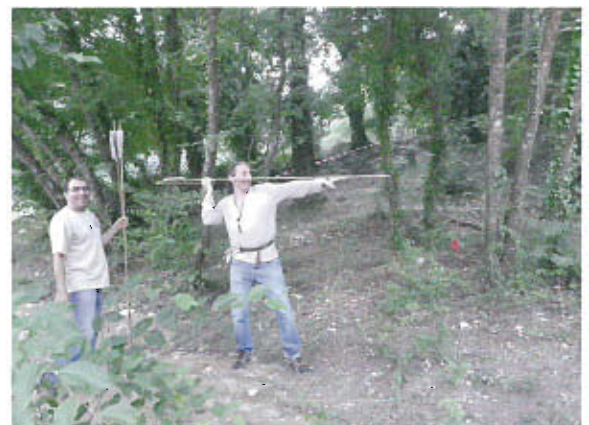
Tir au propulseur

Avec des visiteurs nombreux, enthousiastes et intéressés, les organisateurs ont été largement récompensés de leurs efforts.