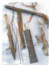
Carquois Afrique Sub-Saharienne

L'exposition concerne plusieurs dizaines d'objets authentiques et rares : arcs, flèches mais aussi arbalètes et sarbacanes. On peut découvrir Pygmées, Bushmen, Yanomami, Papous et d'autres, au travers de leurs techniques ancestrales.