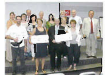
Remise d'un chèque par la CÉCAZ pour notre projet social et culturel (2 juillet 2014)

La SEPP est agréée par l'Académie de Nice pour l'enseignement et la formation, aux élèves et aux enseignants. Tout au long de l'année, se poursuivent également les encadrements d'étudiants, les fouilles et travaux de terrain, la recherche scientifique, colloques, séminaires et publications scientifiques de rang international.