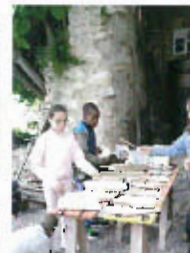
Exposition au musée et réalisation d'un lithophone par les élèves de l'IME de la Corniche Fleurie, Nice