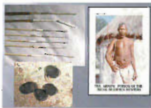
Les Bushmen utilisent un poison très virulent tiré d'un cocon de scarabée associé parfois au latex d'euphorbe