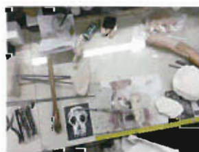
Réalisation du parcours tactile dans le musée ci-dessus : moulages d'objets archéologiques