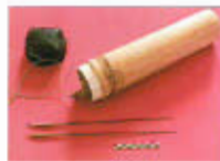
Colombie Fléchettes de sarbacane empoisonnées au venin de grenouille